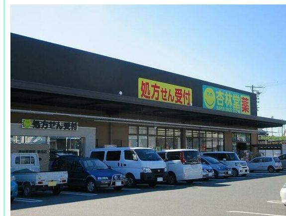
杏林堂薬局於呂店

※この図面はATBBの物件情報の一部を抜粋して掲載しております。(現況優先) ※入居日・引渡日変更や付帯条件、別途料金が発生する場合がありますのでご確認ください。