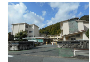
浜松市立二俣小学校

※この図面はATBBの物件情報の一部を抜粋して掲載しております。(現況優先) ※入居日・引渡日変更や付帯条件、別途料金が発生する場合がありますのでご確認ください。