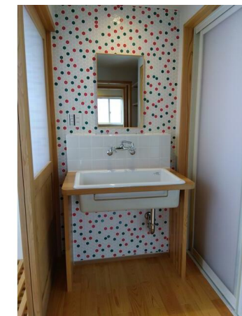
洗面脱衣室の造作洗面台。可愛いタイル張りの壁がアクセントになっています！

※この図面はATBBの物件情報の一部を抜粋して掲載しております。(現況優先) ※入居日・引渡日変更や付帯条件、別途料金が発生する場合がありますので確認ください。