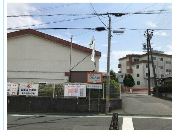
浜松市立浜北北部中学校

※この図面は物件情報の一部を抜粋して掲載しております。(現況優先) ※付帯条件や別途料金が発生する場合がありますのでご確認ください。