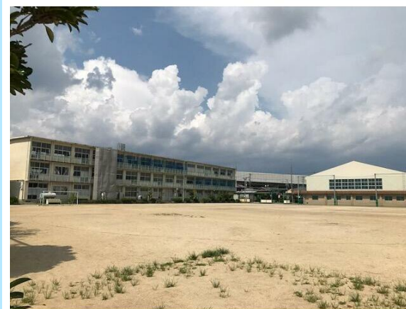
浜松市立赤佐小学校