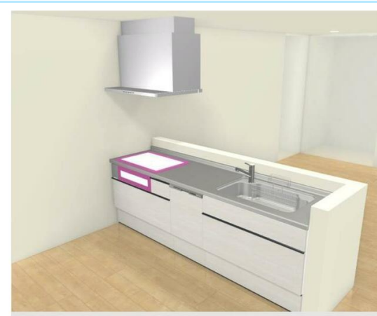
キッチンイメージ