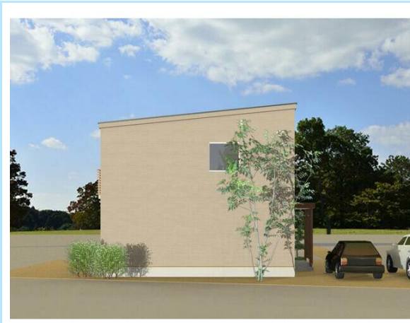
部屋間の段差が無くスッキリとした造りで、掃除がしやすい!とのご感想を頂きました